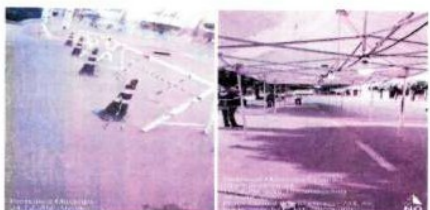
APOIO OPERACIONAL ÀS DEMAIS SECRETARIAS