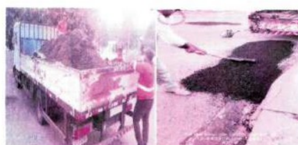
RECUPERAÇÃO DE VIAS PÚBLICAS COM APLICAÇÃO DE MASSA ASFÁLTICA