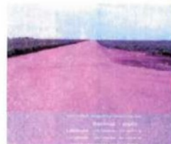
ESTRADA SANTA IRENE LEVANDAMENTO 11KM