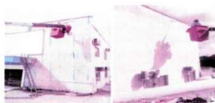
REPAROS ESTRUTURAIS EM PRÉDIOS PÚBLICOS