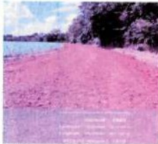
ESTRADA CARLOS REFAT LEVANDAMENTO E CASCALHAMENTO 8 KM