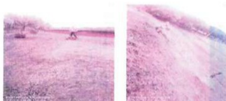
MANUTENÇÃO DOS CAMPOS ESPORTIVOS MUNICIPAIS