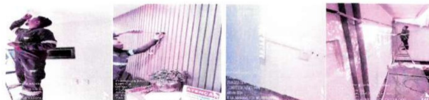
MANUTENÇÃO HIDRÁULICA E ELÉTRICA DE PRÉDIOS PÚBLICOS;