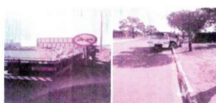
INSTALAÇÃO DE PLACAS DE SINALIZAÇÃO E PINTURA DE MEIO-EM VIAS.