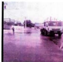
PODA DE ÁRVORES, LIMPEZA DE CANTEIROS E LAVAGEM DE VIAS COM UTILIZAÇÃO DE CAMINHÃO-PIPA.