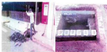
LIMPEZA DE BOCAS DE LOBO E CONSTRUÇÃO DE BOCAS DE LOBO FIO