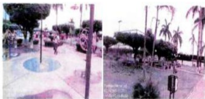
LIMPEZA GERAL E PODA DE ÁRVORES