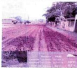
ESTRADA CHÁCARA LEVANDAMENTO E CASCALHAMENTO 12K