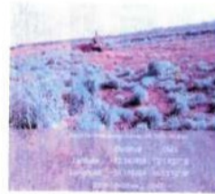
ATERRAMENTO DO TREVO DO COPO SUJO