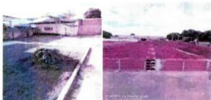
SERVIÇOS DE CARPINTARIA E ALVENARIA