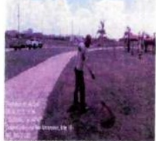
MANUTENÇÃO E CONSERVAÇÃO PRAÇA GOLD VALLE