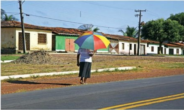
Marmelópolis, Minas Gerais, 2013.

Observe as imagens a seguir e comente-as levando em consideração a quantidade, o tamanho e o tipo de construção de cada uma delas: