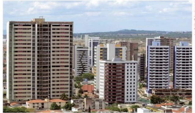
Caruaru, Pernambuco, 2013.

2- As paisagens urbanas caracterizam-se pela presença de diversos tipos de atividades econômicas. Cite dois deles: