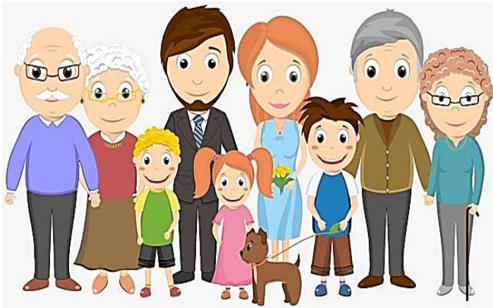
BIG - GRANDE

YOUR FAMILY IS BIG OR SMALL ? SUA FAMÍLIA É GRANDE OU PEQUENA ?