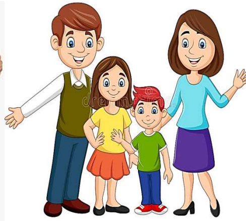
SMALL - PEQUENA

1- AGORA, PINTE A FAMÍLIA QUE MAIS SE PARECE COM A SUA E ESCREVA BIG OU SMALL .