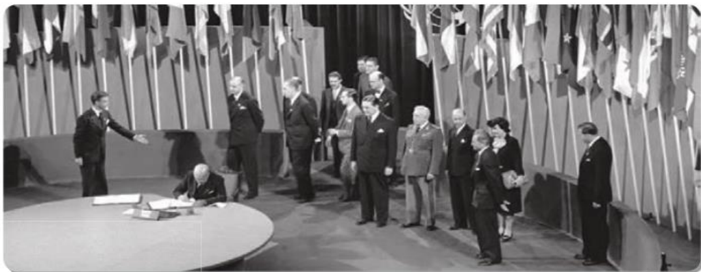
MINISTRO das Relações Exteriores do Brasil, Pedro Leão Velloso, assina a Carta das Nações Unidas, na Conferência de São Francisco, que criou a Organização. 26 jun. 1945. 1 fotografia, p&b.

Esses direitos foram elaborados com o objeto de evitar guerras, injustiças, desigualdades sociais e situações de preconceito, por exemplo. Na época, o mundo havia enfrentado duas guerras mundiais , que feriram e mataram muitas pessoas e deixaram diversas crianças órfãs. Além disso inúmeras cidades foram destruídas durante essas guerras. Por causa dessas consequências, a ONU resolveu elaborar um documento para que todas as pessoas tivessem a oportunidade de viver um futuro melhor, em paz.