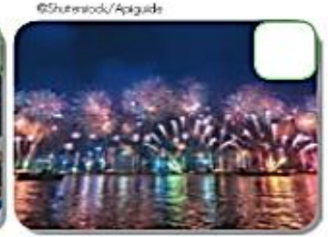
New Year's Eve