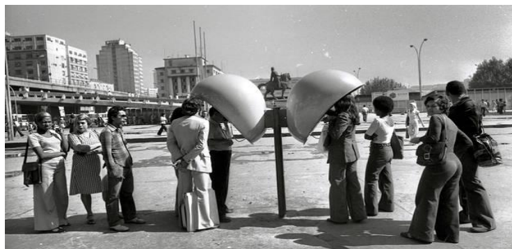
Fila para uso do telefone público, chamado de orelhão, 1978.

A tecnologia e a comunicação em rede proporcionaram maior agilidade na transmissão e distribuição das informações, incluindo textos, imagens, vídeos e sons. O avanço das tecnologias e dos meios de comunicação também influenciou diversos setores da economia, como, por exemplo, a indústria, com a oferta de novas máquinas e equipamentos. As relações comerciais também mudaram muito, em especial devido à possibilidade de realizar compras pela internet.