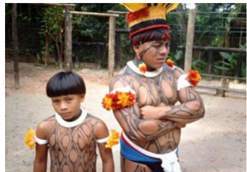
Indígenas do Parque Indígena do Xingu no MT.

2- Porque os europeus chamaram os povos que habitavam a terra descoberta de ÍNDIO?