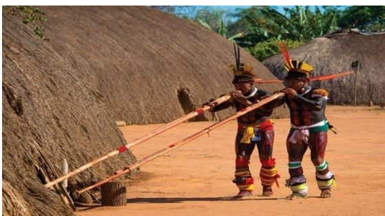
Festa do kuarup, Gaúcha do Norte, no Mato Grosso

Apesar de existirem semelhanças entre alguns grupos indígenas, em geral, esses povos são diferentes entre si, pois cada um tem hábitos e costumes próprios.